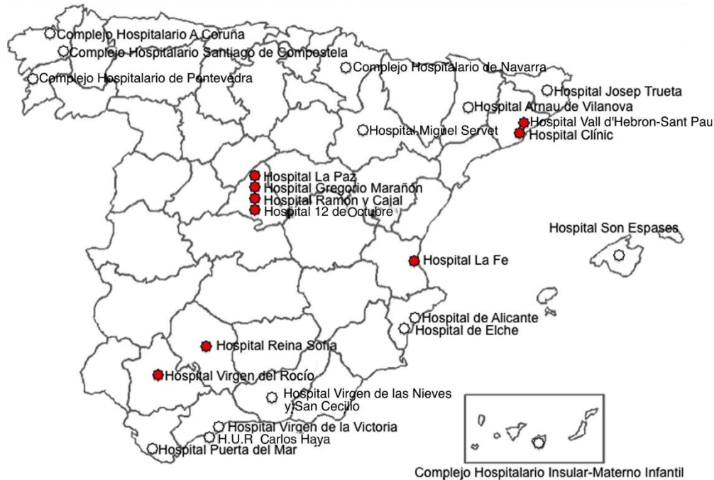
Figura 1. Distribución en España de centros de Cardiopatías Congénitas del Adulto 2019.